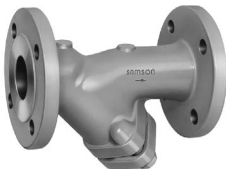
figuur 1 · type 2N/2NI